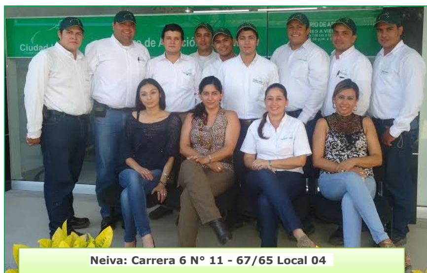
Neiva: Carrera 6 N° 11 - 67/65 Local 04

Los usuarios que accedan al beneficio deben tener en cuenta que la acreditación del inmueble tendrá vigencia solo de tres (3) meses, al vencerse este tiempo, deberá repetir el mismo procedimiento.