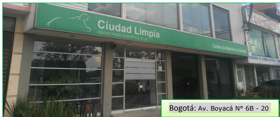
Bogotá: Av. Boyacá N° 6B - 20

por la Comisión de Regulación de Agua Potable y Saneamiento CRA, es posible que, como usuario del servicio de aseo, pueda acceder a este beneficio, evidenciando que el predio se encuentra desocupado.