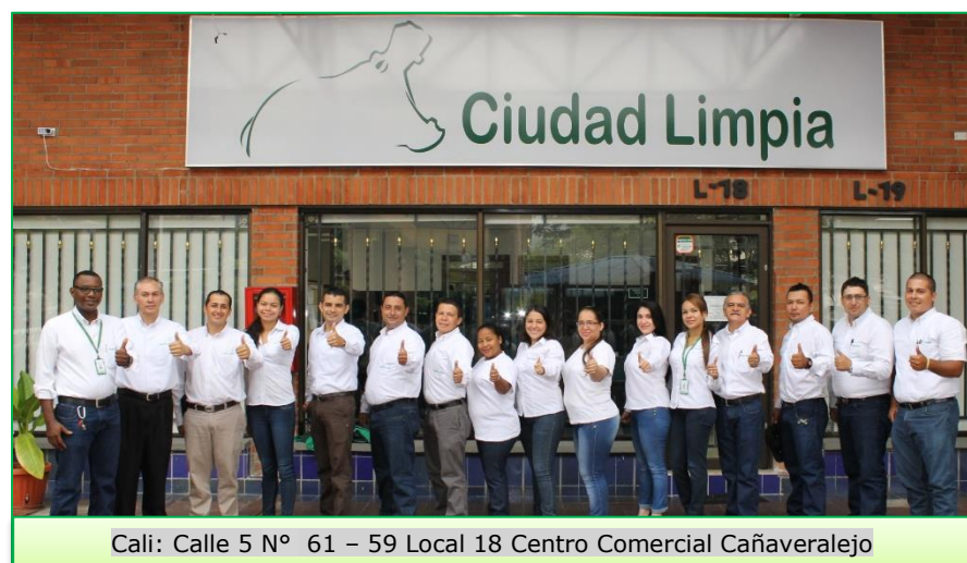
Cali: Calle 5 N° 61 - 59 Local 18 Centro Comercial Cañaveralejo